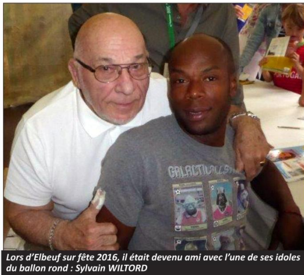
Lors d'Elbeuf sur fête 2016, il était devenu ami avec l'une de ses idoles du ballon rond : Sylvain WILTORD

Concernant la compétition, il est très difficile d'énumérer ses propres résultats tant individuels que par équipe, de Seine-Maritime à celui d'Interrégions, voire au-delà. Il avait su donner