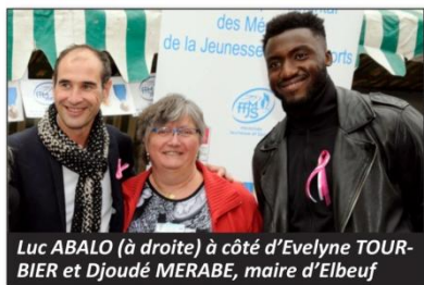
Luc ABALO (à droite) à côté d'Evelyne TOURBIER et Djoudé MERABE, maire d'Elbeuf

Le dimanche 10 septembre, sous un soleil frais mais radieux, s'est déroulée la manifestation Elbeuf-sur-Fête, grand rassemblement des associations sportives, culturelles et caritatives de l'agglomération elbeuvienne, avec pour point d'orgue un invité d'honneur, sportif de très haut niveau et membre de l'équipe de France, le très sympa-