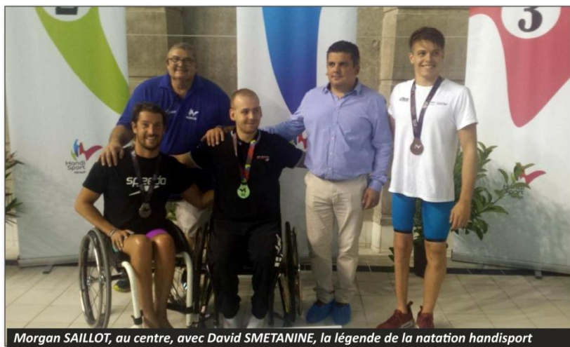
Article et photo parus dans « Paris-Normandie »