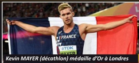
Kevin MAYER (décathlon) médaille d'Or à Londres