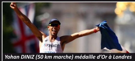
Yohan DINIZ (50 km marche) médaille d'Or à Londres