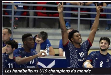
Les handballeurs U19 champions du monde

Beaucoup de choses nous sourient cette année : un florilège de titres européens et mondiaux dans diverses disciplines sportives remportés par des sportifs valides et handicapés plus l'organisation des Jeux