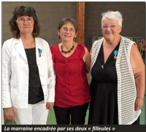
La marraine encadrée par ses deux « filleules »